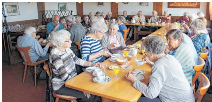
Mit den Frühstück beginnt das Programm.

Anmeldung (falls noch Plätze frei sind): Evangelisches Dekanatsamt, Dekanstraße 4, 73430 Aalen, Telefon 07361-95620, E-Mail: bernhard.richter@elkw.de oder beim Kath. Pfarrbüro, Bohlststraße 3, 73430 Aalen, Telefon 07361-370 58 100, salvator.aalen@drs.de. - Gesamtkosten: 135 Euro, IBAN DE15 61450050 0110 004408, Gesamtkirchengemeinde AA, betreff: Urlaub ohne Koffer und Name des Teilnehmers.